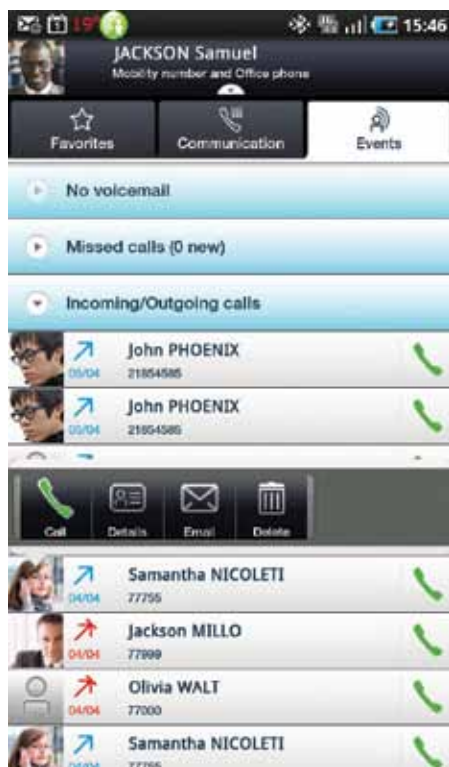
Captura de pantalla de My IC Mobile para Android

Cada vez son más los empleados que trabajan con flexibilidad para sus empresas utilizando el dispositivo adecuado para el contexto y con servicios que le permiten trabajar con la máxima eficiencia. La movilidad es un activo fundamental que permite a los usuarios permanecer estrechamente conectados con sus empresas y asegurar la continuidad del negocio. Las soluciones Alcatel-Lucent OmniTouch 8600 My Instant Communicator Mobile Edition para smartphones ayudan a aumentar de forma considerable la productividad de los usuarios. Con esta avanzada aplicación, se dota a los empleados móviles de toda la potencia de las comunicaciones unificadas móviles, incluidos los servicios de telefonía y el acceso a numerosas modalidades de comunicación, con una sola interfaz que además es muy fácil de utilizar.